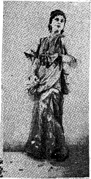
Η κ. Μαίρη 'Αρώνη στον ρόλο της 'Ερωτίλης.

«Υστερα από το «Μάριβα», το θέατρο Μαρίας Κοτοπούλη, συνεχίζοντας την καλλιτεχνική του φεινή προσπάθεια, μας έδωσε — την περασμένη Δευτέρα — μία κλασική κωμωδία: